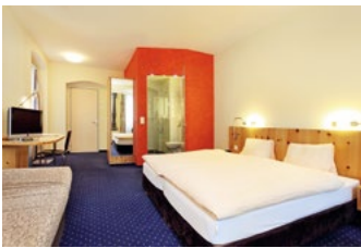
Hotel Freieck*** Reichsgasse 44, 7000 Chur freieck.ch

Gemütlich und mitten in der – nachts verkehrsfreien – Altstadt gelegen. Eine Mischung von modernem Design und traditioneller Baukunst. Preisspanne: 110.– bis 160.– Franken. In Gehdistanz zu den Veranstaltungsorten. Keine Parkplätze; öffentliche Parkhäuser in der Nähe.