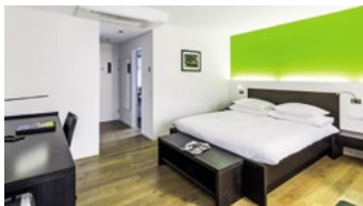
Hotel ABC**** Ottostrasse 8, 7000 Chur hotelabc.ch